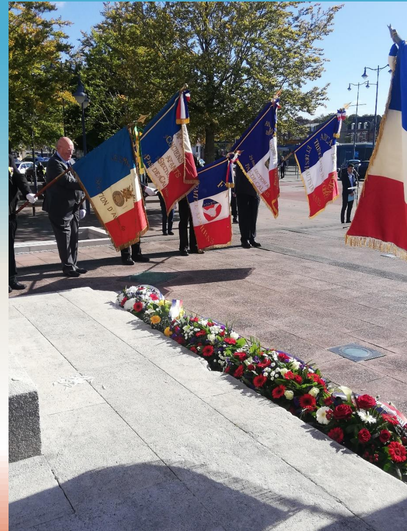
Hommage aux Morts