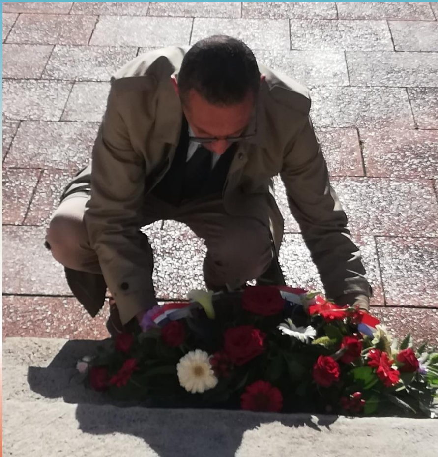
Le représentant de la Communauté des Harkis