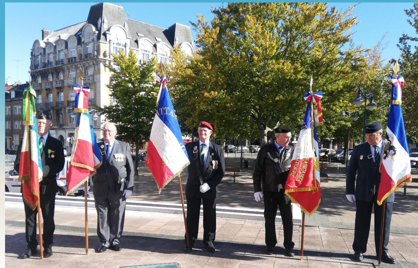
Les porte-drapeaux du Comité d'entente ACVGSP d'Arras